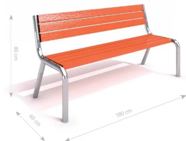
Ławka nierdzewna 2