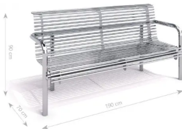
Rys. 1. Wymiary urządzenia