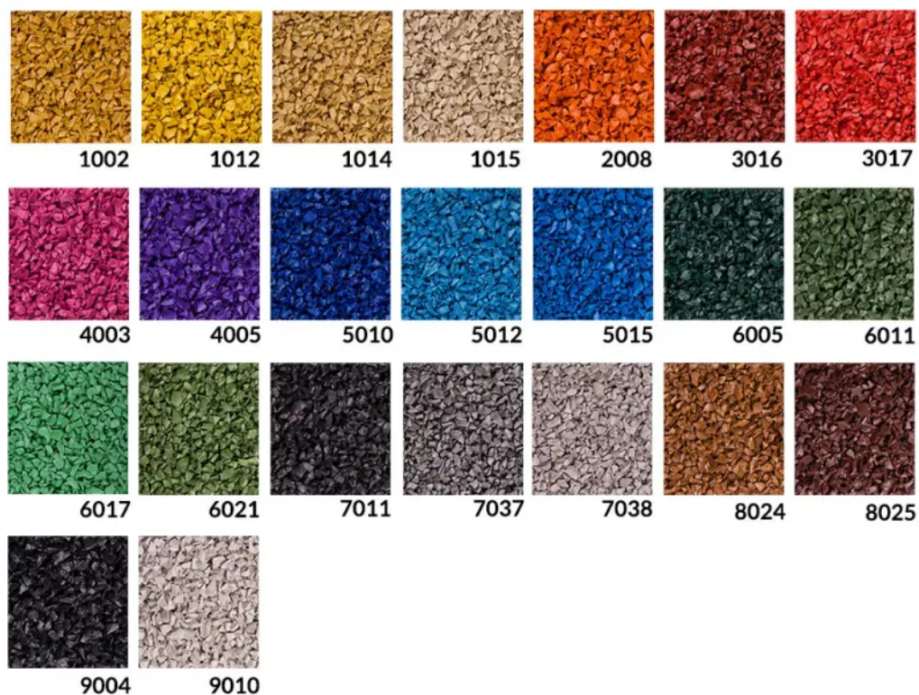
Rys. 5. Dostępna kolorystyka osłony trampoliny - SBR